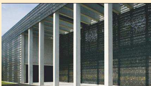
Das Ehrenmal der Bundeswehr von außen und von innen.

Nach der spannenden Gesprächsrunde über Kritikwürdiges an der Sicherheitspolitik im Allgemeinen und der Bundeswehr im Besonderen, besichtigten wir zusammen mit Oberstleutnant Kühnke das Ehrenmahl der Bundeswehr.